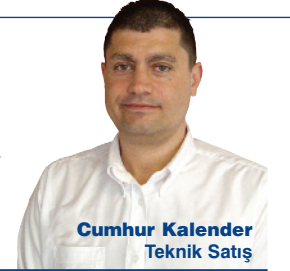
Cumhuriyet Kalender Teknik Satış